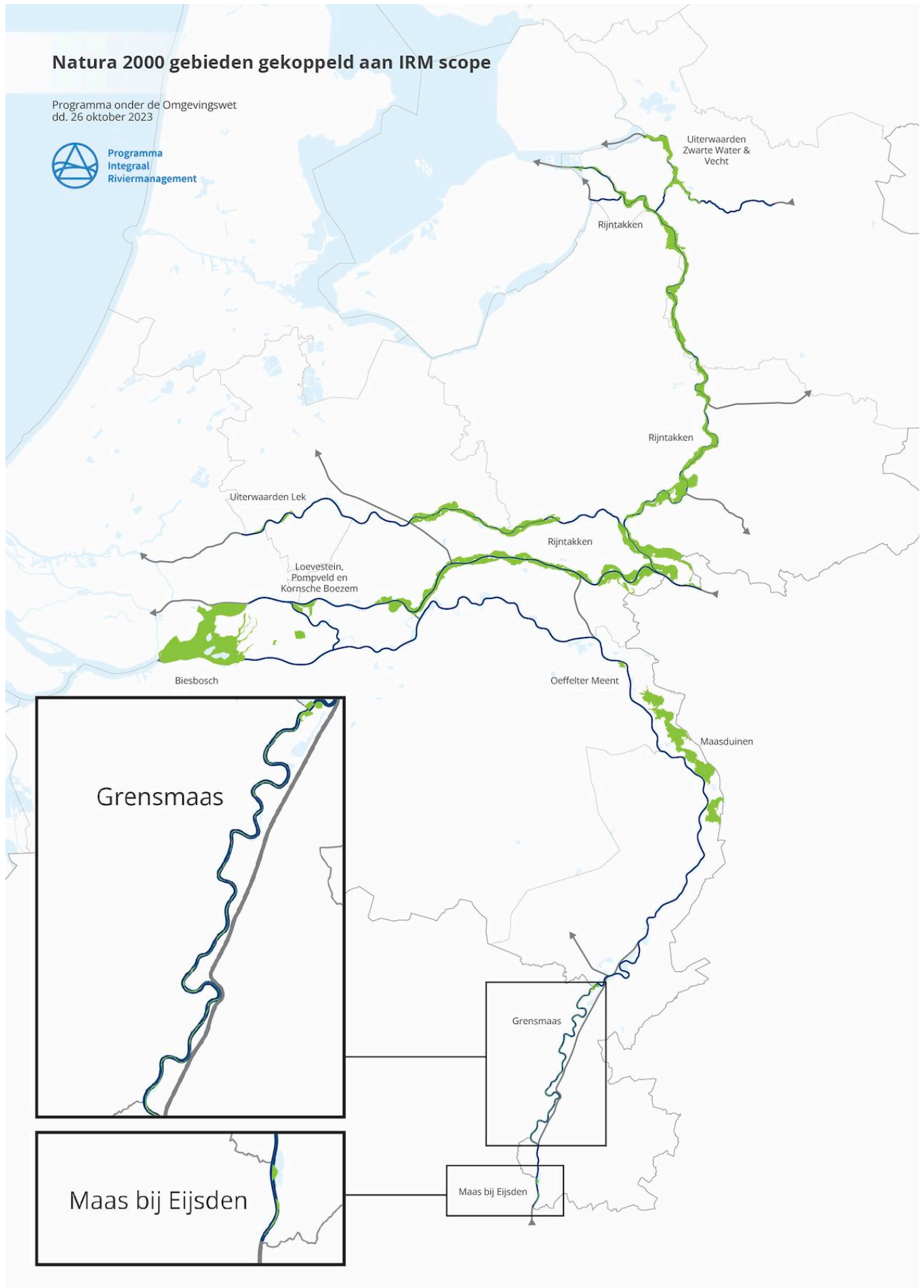
Figuur 3-1 Ligging Natura 2000-gebieden binnen IRM