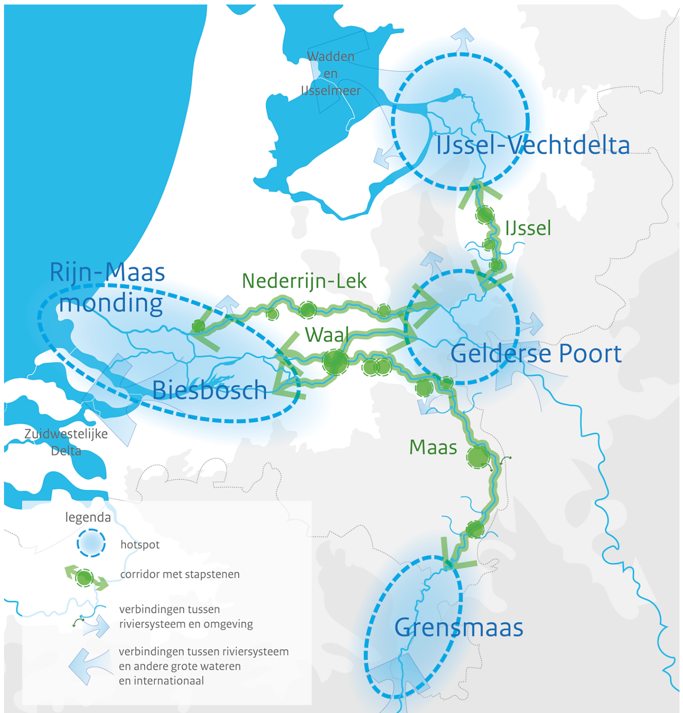
Figuur 4-4 Illustratie van natuurnetwerk grote rivieren (Heusden et al., 2021)

Maatregelen die nu al zijn benoemd en vastgelegd in het kader van de natuurafspraken tussen rijk en provincie, de KRW en de beheerplannen voor Natura 2000 vormen een gegeven en een vertrekpunt. Dit is vaststaand beleid en hoeft niet nogmaals in het kader van IRM passend beoordeeld te worden.